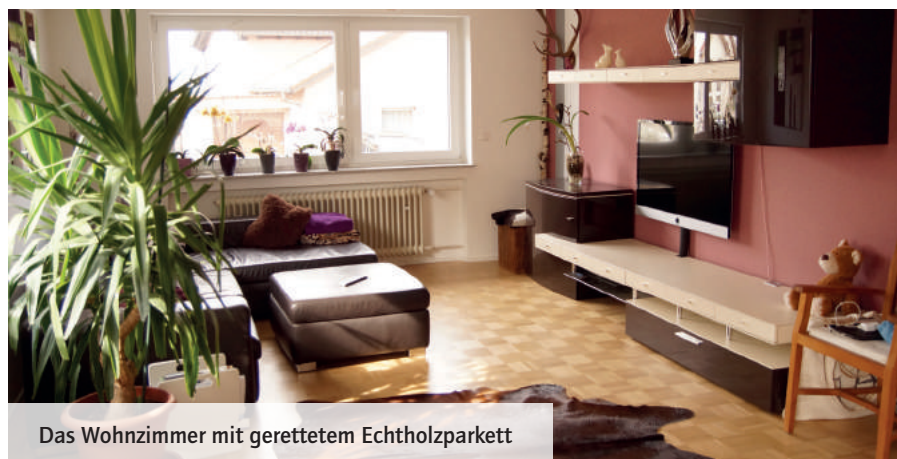
Das Wohnzimmer mit gerettetem Echtholzparkett