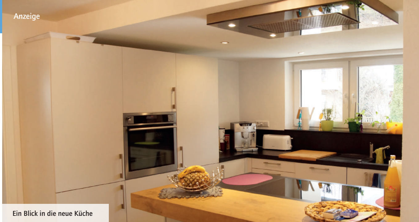
Ein Blick in die neue Küche