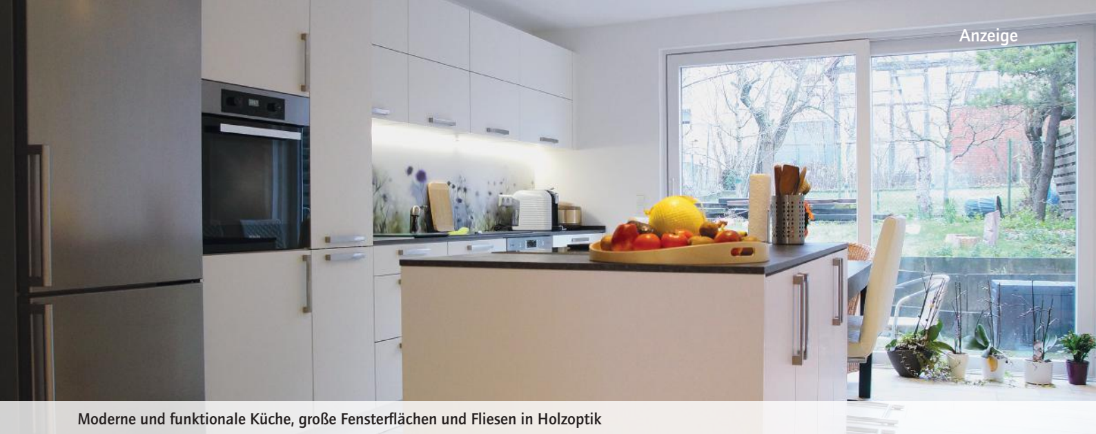
Moderne und funktionale Küche, große Fensterflächen und Fliesen in Holzoptik